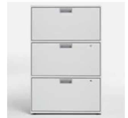
Fronten Fronts Faces avant Elementi frontali