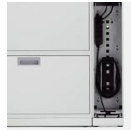
E-Modul E-module Module E Modulo E