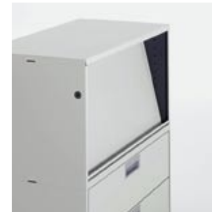
Schrägtablar Inclined shelf Rayon incliné Ripiano inclinato