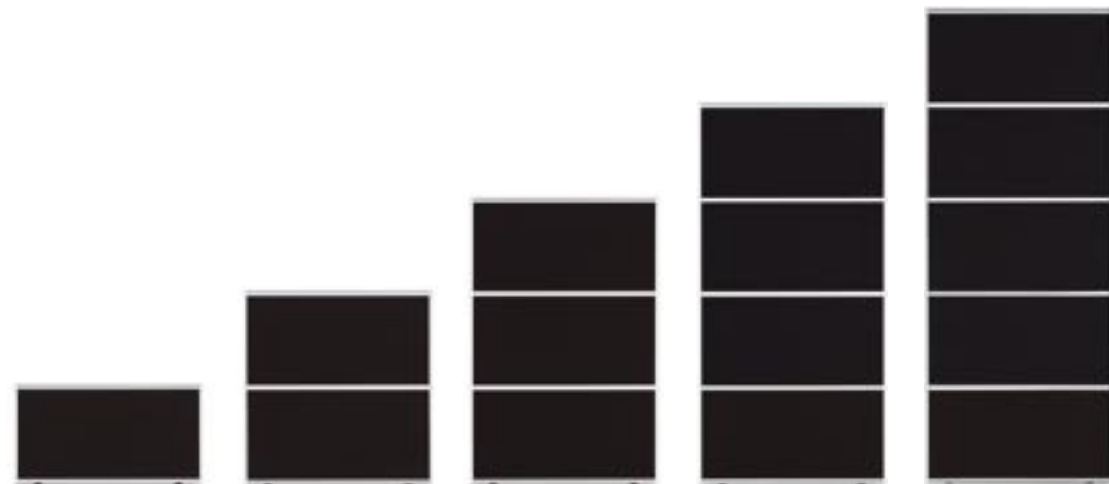
Wandmodule Wall modules Modules de cloison Moduli per pareti