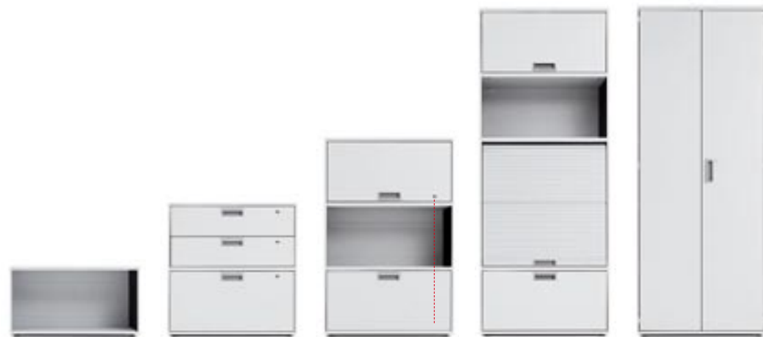
Einzelverschluss Individual locking Fermeture individuelle Chiusura singola