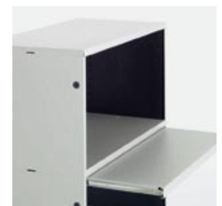
Ausziehtablar Pull-out shelf Rayon extensible Ripiano estraibile