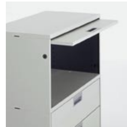
Klappe Flap Rabat Ribalta

Lista QUB soddisfa le massime esigenze. Il prodotto è naturalmente caratterizzato da una qualità di lavorazione senza compromessi, da una straordinaria precisione di fabbricazione, e dall'impiego di materiali pregiati. Ne deriva un sistema avveniristico che, anche in futuro, conserverà l'impronta della perfezione.