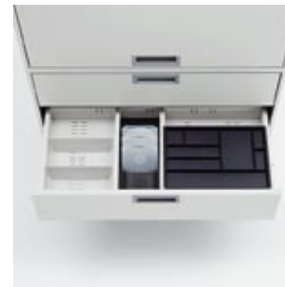
Einteilungsmaterial Partition material Matériel de subdivision Materiale di suddivisione