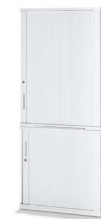
ARMOIRE COMBINÉE COMBIKAST

GRÂCE À LEUR DIVERSITÉ, LES FAÇADES S'HARMONISENT AVEC TOUS LES TYPES D'AGENCEMENTS ET DE PIÈCES. LES PORTES BATTANTES, LES TABLETTES, LES PORTES COULISSANTES, LES VOIETS LATÉRAUX ET LES TIROIRS SONT COMBINABLES EN FONCTION DES BESOINS ET FONT DE CHAQUE VARIANTE UN POINT DE MIRE. LA TRAME DE HAUTEUR MODULAIRE DE DEUX À SIX HAUTEURS DE CLASSEUR EST À L'ORIGINE D'UNE MULTITUDE DE CONFIGURATIONS DU VOLUME DE RANGEMENT. IL EST AINSI POSSIBLE DE PERSONNALISER LE POSTE DE TRAVAIL EN FONCTION DU VOLUME DE RANGEMENT NÉCESSAIRE.