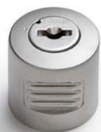
OLIVE TOURNANTE avec serrure DRAAIKNOP met slot