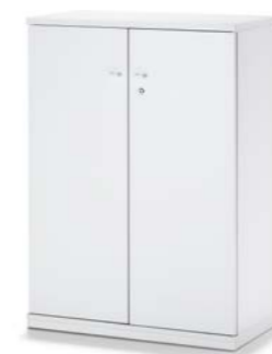
ARMOIRE À PORTES BATTANTES DRAAIDEURKAST