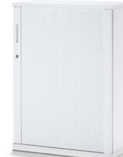
ARMOIRE À RIDEAU LATÉRAL JALOEZIEDRAAIDEURKAST