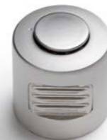
BOUTON TOURNANT DRAAIKNOP