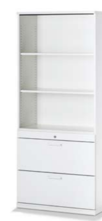
ARMOIRE COMBINÉE COMBIKAST