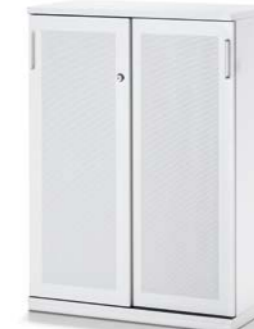
ARMOIRE À PORTE COULISSANTE AVEC FAÇADE ACOUSTIQUE SCHUIFDEURKAST MET AKOESTISCH FRONT