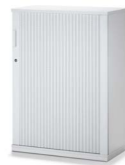
ARMOIRE À RIDEAU LATÉRAL AVEC FAÇADE ACOUSTIQUE HORIZONTALE JALOEZIEDEURKAST MET AKOESTISCH FRONT