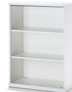
RAYONNAGE OPEN KAST