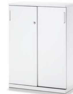
ARMOIRE À PORTE COULISSANTE SCHUIFDEURKAST