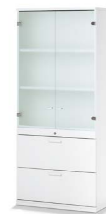
ARMOIRE COMBINÉE COMBIKAST