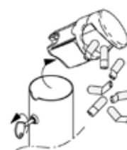
Particolare posacenere asportabile