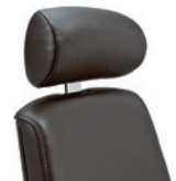
Hoofdsteun verstelbaar Appuie-tête, réglable