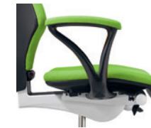
Vaste armleuningen bekleed Accoudoirs fixes rembourrés