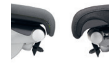
Standaardbekleding (links) Comfortbekleding (rechts) Rembourrage standard (à gauche), rembourrage confort (à droite)