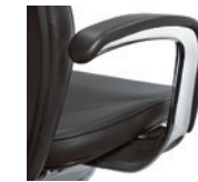
Armleuningen gepolijst Accoudoirs, rembourrés