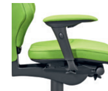
4D-armleuningen* bekleed Accoudoirs 4D* rembourrés

* 1D = hoogte verstelbaar réglable en hauteur 4D = hoogte-, breedte- en diepte verstelbaar réglable en hauteur, en largeur et en profondeur