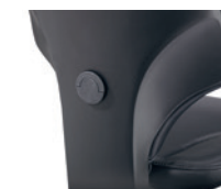
Diepte instelbare lendensteun Soutien lombaire réglable en profondeur

* 1D = hoogte verstelbaar réglable en hauteur 4D = hoogte-, breedte- en diepte verstelbaar réglable en hauteur, en largeur et en profondeur