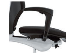
1D-armleuningen* onbekleed Accoudoirs 1D* non rembourrés