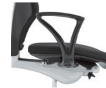
Vaste armleuningen onbekleed Accoudoirs fixes, non rembourrés

Toutes les possibilités de configuration vous sont proposées par le configurateur en ligne sur le site www.giroflex.com