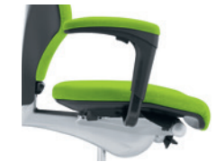
1D-armleuningen* bekleed Accoudoirs 1D* rembourrés