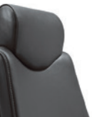
Hoofdsteun vast Appuie-tête, fixe

giroflex 64 – Bureaustoel: de directiefauteuil is verkrijgbaar met comfortbekleding, brede zitting, hoge rugleuning (desgewenst bekleed). Optioneel met in diepte verstelbare lendensteun. Diverse bekledingsmaterialen in verschillende kleuren. Leverbaar met vaste of 3D-armleuningen, hoofdsteun in twee verschillende uitvoeringen en met kleeerhanger. Vijfarmige voet in gepolijst aluminium of met poedercoating in diverse kleuren. Wielen ø 50 mm of optioneel ø 65 mm.