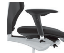
4D-armleuningen* onbekleed Accoudoirs 4D* non rembourrés