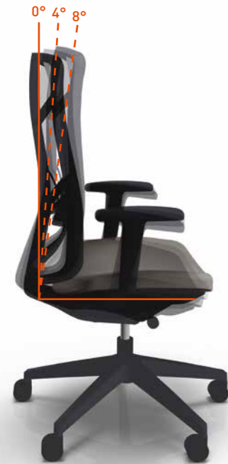
CÔNE DE BASCULEMENT