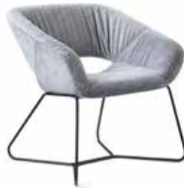
AV 692 PL