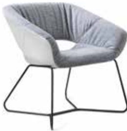
AV 692 PL