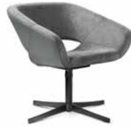
AV 652 PS