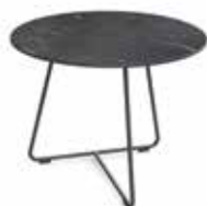
AV 245 SW

DE Bei dem neuen Loungesessel wurde größter Wert auf Bequemlichkeit gelegt. In bewährter Züco-Manier erlaubt das Design, kreativ mit den Materialien und Farben zu spielen. Verschiedene Gestellvarianten sorgen für die unverwechselbare Optik des neuen Loungesessels. Der passende Beistelltisch mit einer Platte wahlweise aus Glas oder HPL in schwarzer oder weißer Marmoroptik rundet das Angebot ab.