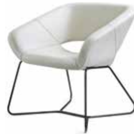
AV 692 PS