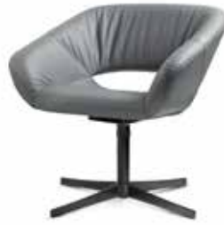
AV 652 PL