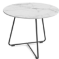
AV 245 WE