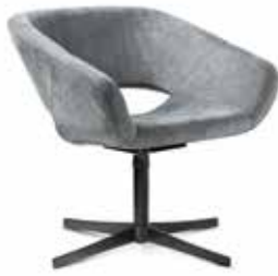
AV 652 PS