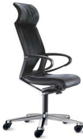
284 / 81