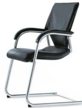
287 / 81