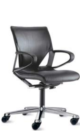
283 / 81

Les courbes tendues des accoudoirs font rimer plaisir des yeux avec plaisir tactile. Ils sont dotés d'une surface de contact en cuir de très belle facture. Les échancrures latérales du dossier sont caractéristiques de la gamme : leurs contours triangulaires se retrouvent au niveau du support d'assise et y gagnent encore en impact visuel.