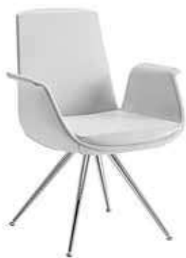
Mod. M D-004