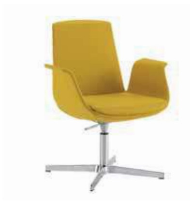
Mod. M D-012 M ec. Gaslift