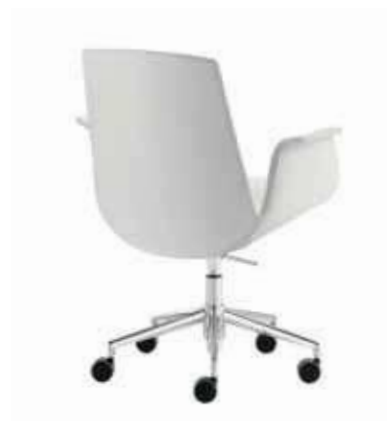
Mod. M D-010 M ec. Gaslift