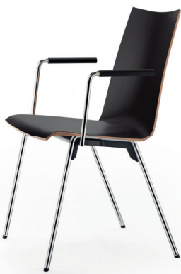
accoudoirs · armrests

SAFE CONNECTION, THEREBY MINIMIZED RISKS IN CASE OF EMERGENCY