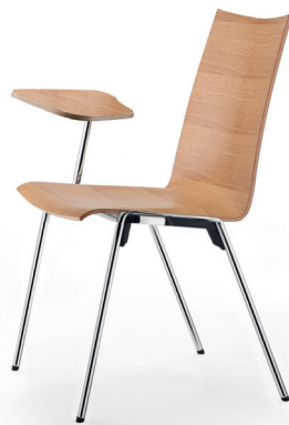
tablette écrivain · writing tablet